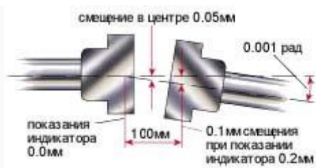
Рис. 9.5 Пример допустимой расцентровки при скорости машины - 1800 об/мин