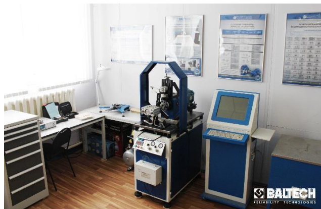
Стенд контроля качества подшипников ПРОТОН-СПП-II