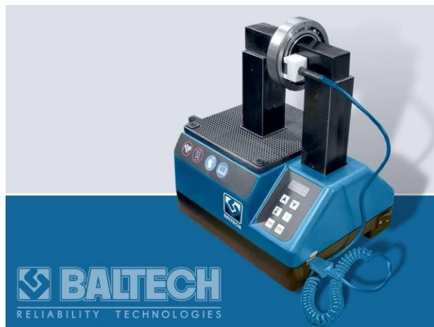
BALTECH HI-1610 индукционный нагреватель