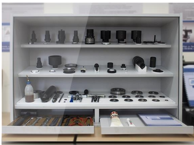
Учебный стенд BALTECH Bearing монтаж/демонтаж подшипниковых узлов